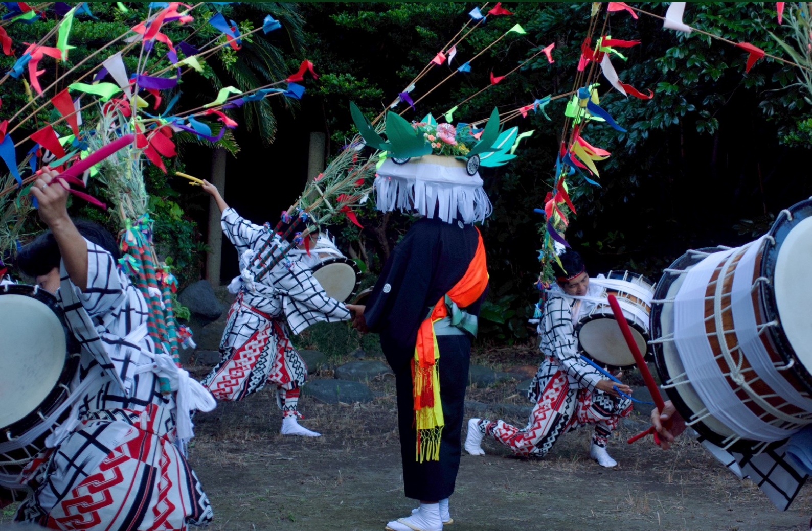
Hassaku taiko odori de l'île d'Iō

23-24 juin 2026 Université d'Aix-Marseille Bâtiment T1 Pôle Multimédia, Salle de Colloque 2