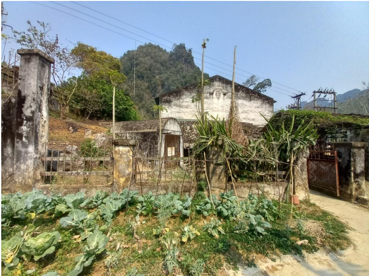
Photographie 3 (ci-dessus) : Vue de l'arrière de l'usine hydroélectrique de Tà Sa. Les fils électriques se dirigent vers la mine de Tĩnh Túc.

Les autres photographies (photographies 2 et 3) donnent d'autres aperçus de cette usine qui reste de taille modeste.