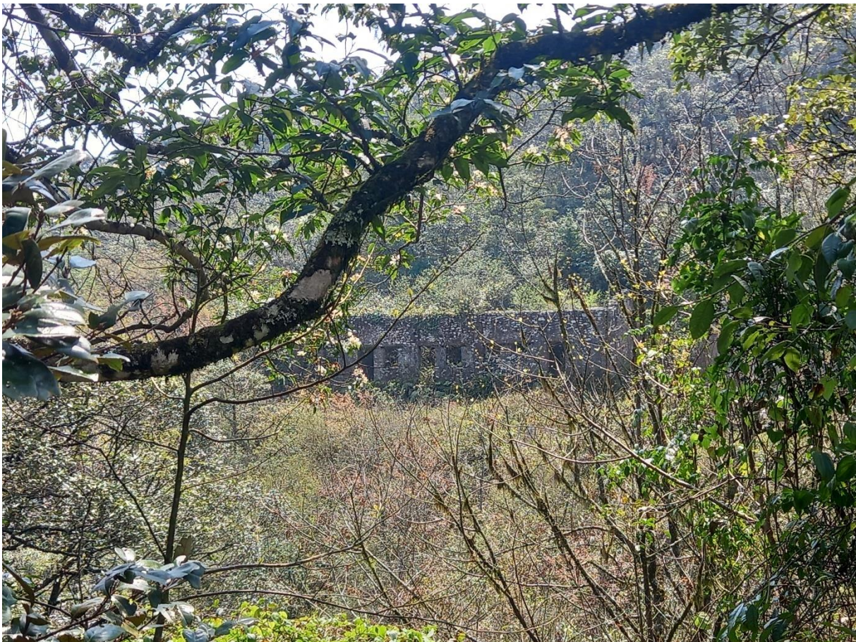
Photographie 6 : Ancien site de traitement des minerais de tungstène de Lung-moi.

La mission de terrain s'est achevée avec différents arrêts dans la région pour capturer les résidus de l'exploitation française. Certains sites ont fait l'objet d'une patrimonialisation partielle, comme c'est le cas du site de Lung-Moi, ancien site de traitement des minerais de tungstène. Le tungstène produit en Indochine a eu un rôle particulièrement important pour l'empire colonial français. En effet, sa production a été largement encouragée financièrement avant et pendant la Seconde Guerre mondiale. Le tungstène est en effet utilisé pour la production de machines-outils, de projectiles militaires ou de blindages. Cependant, aucune métallurgie d'ampleur n'a été réalisée en Indochine. Les bâtiments de traitement que l'on peut toujours apercevoir dans la région (photographie 6 ci-dessous) sont en fait des sites de prétraitement (concassage, broyage, tri des minerais, et grillage), la partie traitement métallurgique ayant été réalisée en hexagone, en Belgique et en Allemagne, pays où les infrastructures métallurgiques existaient déjà.