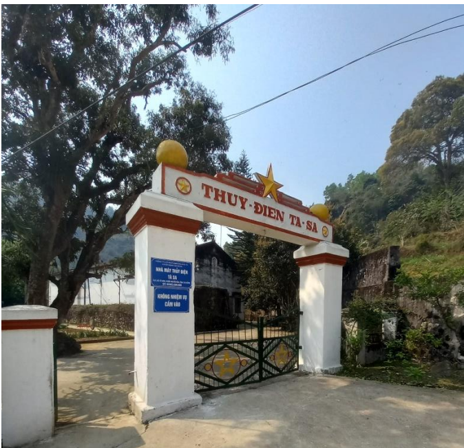
Photographie 2 (gauche) : Entrée de l'usine hydroélectrique de Tà Sa.

Les machines permettant la transformation du courant en électricité sont aujourd'hui chinoises. À l'époque coloniale, l'usine permettait d'alimenter à la fois la mine et le village des travailleurs en électricité, aujourd'hui, et étant donné l'augmentation des besoins énergétiques de la mine, l'usine n'alimente que la mine. Nous ignorons si la mine actuelle utilise d'autres sources énergétiques que cette usine.