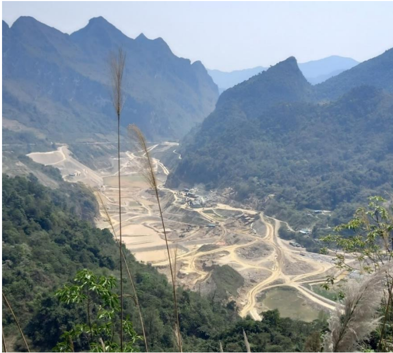
Photographie 4 : mine d'étain-tungstène de Tĩnh Túc, située à l'ouest de Cao Bằng.

L'exploitation à ciel ouvert nécessite le pompage des eaux souterraines, ce qui explique les gradins « secs » sur la photographie des années 1930. Aujourd'hui, ces anciens gradins sont remplis d'eau ou de déchets miniers (boues de différentes couleurs). L'exploitation de la mine se fait en effet aujourd'hui en souterrain. Il est raisonnable de supposer que la plupart des bassins (anciens gradins non pompés désormais) datent de l'exploitation française, bien qu'ils aient pu être exploités après l'indépendance.