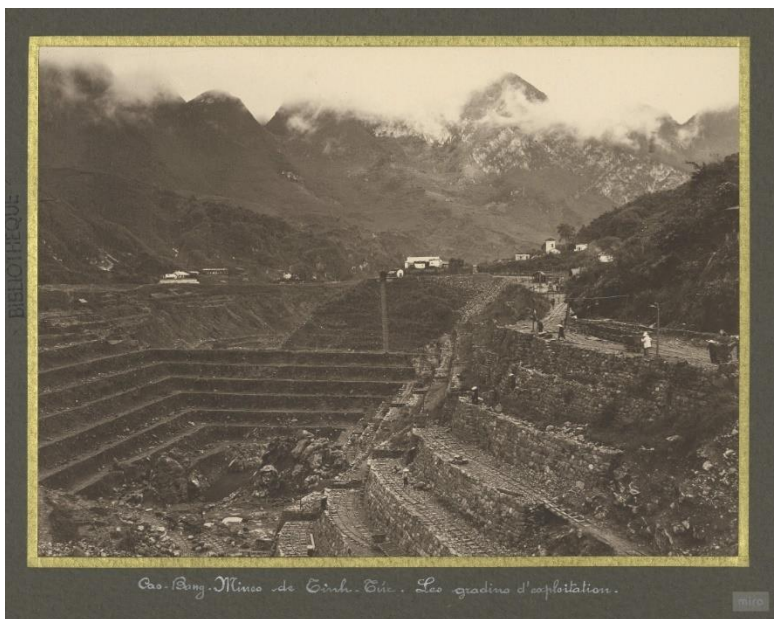
Photographie 5 : Gradins d'exploitation de la mine de Tinh Tuc, commande du Gouvernement Général de l'Indochine, 1921-1931.

L'exploitation à ciel ouvert nécessite le pompage des eaux souterraines, ce qui explique les gradins « secs » sur la photographie des années 1930. Aujourd'hui, ces anciens gradins sont remplis d'eau ou de déchets miniers (boues de différentes couleurs). L'exploitation de la mine se fait en effet aujourd'hui en souterrain. Il est raisonnable de supposer que la plupart des bassins (anciens gradins non pompés désormais) datent de l'exploitation française, bien qu'ils aient pu être exploités après l'indépendance.