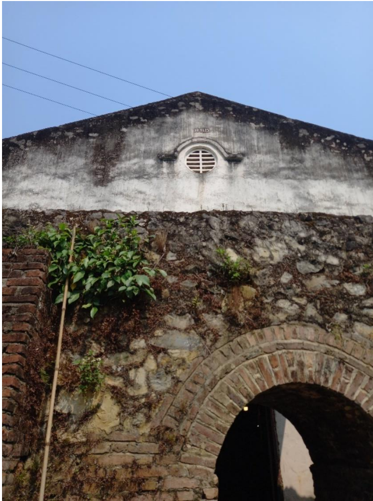
Photographie 1 : Mur d'époque en pierre de l'usine de Tà Sa. Inscription de l'inauguration sur le faitage : 10 septembre 1919.

Les machines permettant la transformation du courant en électricité sont aujourd'hui chinoises. À l'époque coloniale, l'usine permettait d'alimenter à la fois la mine et le village des travailleurs en électricité, aujourd'hui, et étant donné l'augmentation des besoins énergétiques de la mine, l'usine n'alimente que la mine. Nous ignorons si la mine actuelle utilise d'autres sources énergétiques que cette usine.